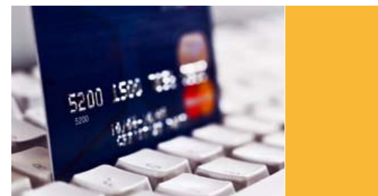
Оборот на работающую карту в месяц, тыс. руб.