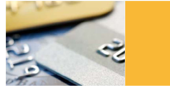
Ежемесячный тарифный доход на 1 работающую карту (руб.)